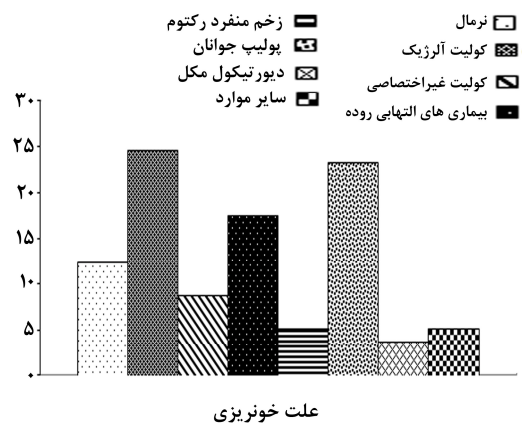
نمودار ۱- توزیع علل خونریزی گوارشی تحتانی در کودکان بستری در بیمارستان افضلی پور کرمان

شایع‌ترین یافته اندوسکوپی (۴۱/۳٪، ۵۷ نفر)، و پاتولوژی (۵۰/۷٪، ۷۰ نفر) کولیت بود. پولیپ، به خصوص در سنین ۱۲-۲ سال از درصد بالایی (۶۳/۱٪) برخوردار بود. اکثر کودکانی که به دلیل ملنا مراجعه کرده بودند (۵ نفر از ۸ نفر) دیورتیکول مکل داشتند. سه علت عمده خونریزی گوارشی تحتانی در کودکان مورد مطالعه عبارت بودند از: کولیت آلرژیک (۲۴/۶٪)، پولیپ (۲۳/۲٪)، بیماری التهابی روده (۱۷/۴٪) (نمودار ۱).