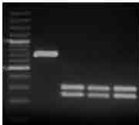
شکل ۲- الکتروفورز محصول PCR نشانگر مولکولی ۱۰۰ جفت بازی M: کاندیدا کفیر، ۱: کاندیدا البیکنس، ۲، ۳، ۴

به طور کاملاً تصادفی تنها عامل قارچی درگیری در عفونت‌های بیمارستانی در این مطالعه، جنس کاندیدا شناسایی و جداسازی شد. کاندیدا البیکنس (۸۹٪) نسبت به سایر گونه‌های کاندیدا گلابراتا (۵٪)، کاندیدا تروپیکالیس (۲٪)، کاندیدا کفیر (۲٪) و کاندیدا دابلننسیس (۲٪)، فراوان‌ترین گونه کاندیدی درگیر در عفونت‌های بیمارستانی شناخته شد. در روش محیط کشت کروم اگر کاندیدا جهت تعیین هویت مخمرها در سطح گونه، کاندیدا البیکنس، کاندیدا دابلننسیس و کاندیدا تروپیکالیس شناسایی و جداسازی شدند (شکل ۱).