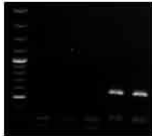
شکل ۳- کاندیدا البیکنس چاهک ۵،۶،۷، و کاندیدا گلابراتا چاهک، ۸ و ۹