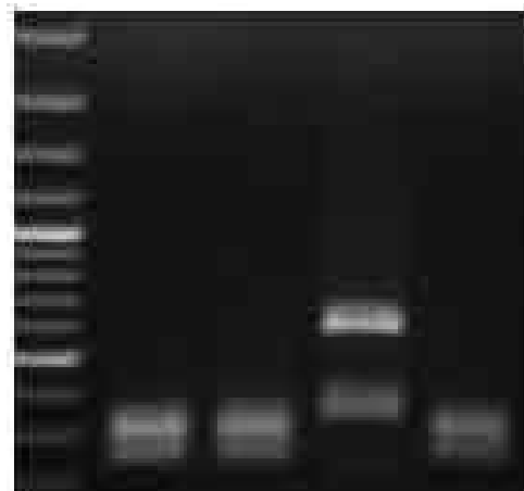
شکل ۴- کاندیدا البیکنس چاهک‌های ۱۰، ۱۱، ۱۲ و کاندیدا گلابراتا چاهک ۱۳ می‌باشد.