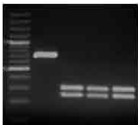
شکل ۲- الکتروفورز محصول PCR نشانگر مولکولی ۱۰۰ جفت بازی M: کاندیدا کفیر، ۱: کاندیدا البیکنس، ۲، ۳، ۴

به طور کاملاً تصادفی تنها عامل قارچی درگیری در عفونت‌های بیمارستانی در این مطالعه، جنس کاندیدا شناسایی و جداسازی شد. کاندیدا البیکنس (۸۹٪) نسبت به سایر گونه‌های کاندیدا گلابراتا (۵٪)، کاندیدا تروپیکالیس (۲٪)، کاندیدا کفیر (۲٪) و کاندیدا دابلیننسیس (۲٪)، فراوان‌ترین گونه کاندیدی درگیر در عفونت‌های بیمارستانی شناخته شد. در روش محیط کشت کروم اگر کاندیدا جهت تعیین هویت مخمرها در سطح گونه، کاندیدا البیکنس، کاندیدا دابلیننسیس و کاندیدا تروپیکالیس شناسایی و جداسازی شدند (شکل ۱).