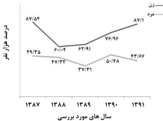
نمودار ۲- میزان بروز اقدام به خودکشی (در صد هزار) به تفکیک جنسیت در شهرستان‌های لارستان و گراش در سال‌های ۱۳۸۷-۱۳۹۱

شایع‌ترین روش اقدام به خودکشی مصرف بیش از حد دارو با فراوانی ۶۹۱ نفر (۹۰/۹٪) بود. مهم‌ترین علت مطرح شده برای اقدام به خودکشی به ترتیب مشکلات خانوادگی با فراوانی ۲۹۱ نفر (۶۱/۷٪) و بیماری جسمی یا روانی با فراوانی ۱۵۱ مورد (۳۲٪) بوده است. بیشترین موارد اقدام در فصل پاییز، افراد فاقد سابقه بیماری جسمی و روانی و بدون سابقه خودکشی در فرد و خانواده مشاهده شد (جدول ۲).