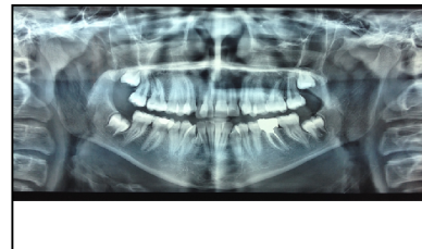
شکل ۴- رادیوگرافی پانورامیک ۶ ماه بعد از جراحی، بهبود نسبی ضایعه را نشان می‌دهد.

محتویات مذکور با استفاده از کورت Hu-Friedy از داخل حفره استخوانی خارج شده و دیواره داخلی حفره به دقت کورتاژ گردید. سپس فلپ به روی حفره برگردانده شد و با نخ سیلک 3/0 و با روش simple سوچور شد. به دلیل آسیب بافت در حین خارج نمودن امکان بررسی میکروسکوپی آن فراهم نگردید. در مراجعه اول بیمار یک هفته بعد از جراحی، برداشت سوچور انجام شد. بیمار از علامت خاصی شکایت نداشت و روند التیام محل جراحی قابل قبول بود. در فالوآپ ۶ ماهه و یک‌ساله بیمار، انجام رادیوگرافی پانورامیک ترمیم استخوانی قابل قبول و عدم عود ضایعه را نشان داد (عکس ۴).