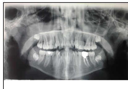
شکل ۱- رادیوگرافی پانورامیک اولیه، ضایعه‌ای رادیولوسنت را در قدام مندیبل نشان می‌دهد.

دختر ۱۴ ساله ایرانی حین انجام درمان ارتودنسی به دلیل مشاهده شدن ضایعه داخل استخوان فک پایین در رادیوگرافی، از طرف ارتودنتیست به بخش بیماری‌های دهان دانشکده دندانپزشکی کرمان ارجاع گردید. در تاریخچه پزشکی بیمار سابقه ابتلا به بیماری سیستمیکی وجود نداشت. بیمار هیچ‌گونه علامتی نظیر درد، بی‌حسی و پاراستزی را در فک‌ها اظهار نمی‌کرد و معاینه داخل دهانی و خارج دهانی نیز هیچ‌گونه علائمی دال بر تورم، عدم تقارن، قرمزی مخاط یا پوست را نشان نداد. رادیوگرافی پانورامیک بیمار که با دستگاه Planmecipromax (kvp:72 mA:10) ساخت کشور فنلاند انجام شده بود، ضایعه رادیولوسنت یونی‌لاکولار با حدود مشخص در ناحیه قدام فک پایین را نشان داد که اندازه تقریبی آن ۱۶*۱۸ میلی‌متر مربع بود (شکل ۱).