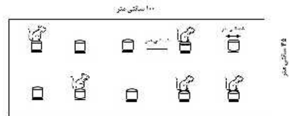
شکل ۲- تکنیک سکوی چندگانه برای القاء محرومیت از خواب

آن: اهمیت بیولوژیکی خواب کافی زمانی آشکار می‌شود که فرد دچار اختلالات فیزیولوژیکی و سایکولوژیکی در ارتباط با محرومیت از خواب شود. زنان بیشتر از مردان اختلالات خواب را تجربه می‌کنند و بیشتر این اختلالات در ارتباط با سیکل جنسی اتفاق می‌افتد. به خاطر اینکه زنان تغییرات هورمونی زیادی را در طول مدت سیکل جنسی به‌خصوص در دوران بلوغ، چرخه قاعدگی، حاملگی و یائسگی تجربه می‌کنند. اینگونه فرض می‌شود که مکانیسم‌های کنترلی خواب نرمال در زنان ممکن است بوسیله استروئیدهای جنسی موجود در گردش خون تحت تأثیر قرار بگیرد [۷۳-۷۴]. هورمون‌های جنسی (تستوسترون در مردان و استروژن‌ها و پروژستین‌ها در زنان) در تعدیل رفتارهای در ارتباط با خواب نقش دارد. مطالعه کوهورت در مردان ۶۵ سال و بالاتر نشان داده