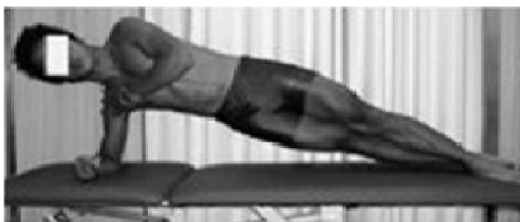
d. آزمون پلانک از طرفین