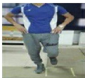
c. آزمون پرش جانبی

در آزمون پرش جانبی آزمودنی کنار خط شروع با پاییی که قصد داشت، آزمون را انجام دهد (پای برتر) می‌ایستاد و پای دیگرش را کمی از مفاصل ران و زانو خم می‌کرد تا با زمین برخورد نداشته باشد، سپس آزمودنی به تعداد ۱۰ بار به صورت رفت و برگشت با حداکثر سرعت، فاصله ۳۰ سانتی‌متری که با دو تکه چسب کاغذی موازی روی زمین مشخص شده بود را به صورت لی‌لی به کنار طی می‌کرد و زمان طی شده با دقت ۰/۰۱ ثانیه به عنوان امتیاز او ثبت