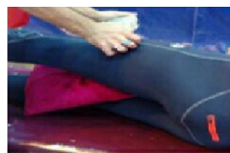
۱۳ ارزیابی قدرت دور کردن ران