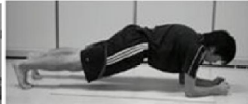
c. آزمون پلانک از جلو

شکل ۱- آزمون های استقامت ناحیه مرکزی بدن