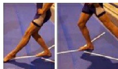
a. آزمون تعادلی Y