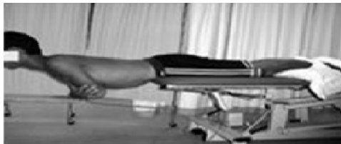
b. آزمون استقامت راست کردن تنه

آزمون راست کننده تنه یا همان آزمون Biering sorensen برای سنجش توانایی عضلات خلفی ناحیه مرکزی بدن به ویژه راست کننده ستون فقرات انجام می-شود. آزمودنی به حالت دمر، طوری که لگن در لبه تخت درمانی قرار گیرد، می-خوابد. یک استرپ برای تثبیت فرد روی تخت در قسمت مچ پا محکم بسته می-شود. آزمودنی در حالی که دستها را به شکل ضربدری روی سینه حفظ کرده است، بالاتنه خود را به صورت افقی نگه می-دارد. مدت زمان حفظ این وضعیت به عنوان استقامت راست کننده تنه او ثبت می-شود. آزمون پلانک به طرفین به عنوان مقیاسی برای ارزیابی عضلات جانبی قسمت مرکزی بدن، به ویژه مربع کمری