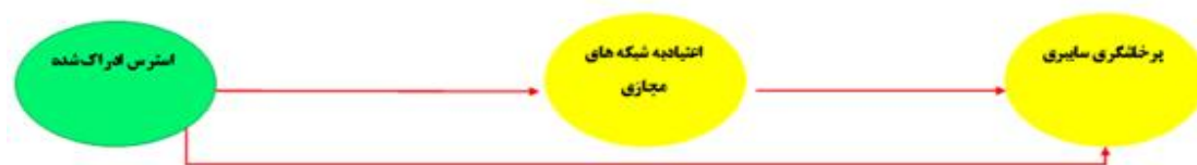
نمودار ۱- مدل مفهومی پیش‌بینی پرخاشگری سایبری دانشجویان دانشکاه محقق اردبیلی در سال ۱۳۹۸ بر اساس استرس ادراک شده با میانجی‌گری اعتیاد به شبکه‌های مجازی

این‌گونه تعریف کردند، بودن بیش‌ازحد در شبکه اجتماعی و یا اختصاص زمان بسیار و تلاش برای ماندن در شبکه‌های اجتماعی که باعث اختلال در فعالیت‌های اجتماعی، مطالعات، شغل، روابط بین فردی و سلامت روانی فرد می‌شود [۱۴]. دانش‌جویان مقدار قابل توجهی از وقت خود را (به طور متوسط چندین بار در روز) صرف برقراری ارتباط از طریق پیام‌های متنی و اجتماعی می‌کنند [۱۵]. هرچند امروزه استفاده از شبکه‌های مجازی تبدیل به یک رفتار مدرن طبیعی شده است ولی شکل‌های آسیب‌زای استفاده از آن‌ها هم در دو دهه اخیر مورد توجه زیادی قرار گرفته است [۱۶]. نتایج پژوهش‌ها و همبستگی‌های به دست آمده نشان‌گر وجود مشکلات عاطفی، ارتباطی، عملکردی و مرتبط با سلامت در معتادان به شبکه‌های اجتماعی است [۱۷]. مطالعات زیادی نشان می‌دهد که وابستگی به شبکه‌های اجتماعی به عوارض شدید منفی از جمله سلامت روان، کیفیت خواب، ارتباط بین‌فردی و عملکرد تحصیلی می‌انجامد [۱۸].