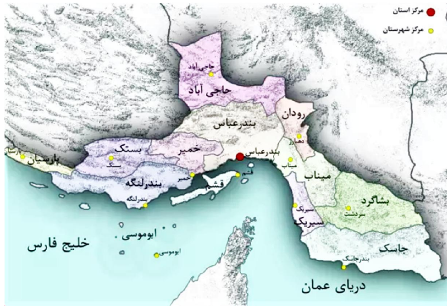
شکل ۱- نقشه استان هرمزگان

هر شهرستان از ابتدای سال ۱۳۹۸ تا انتهای سال ۱۴۰۲ است. داده‌ها از تمامی ۱۳ شهرستان استان شامل شهرستان‌های ابوموسی، بستک، بشاگرد، بندرخمیر، بندرعباس، بندرلنگه، پارسیان، جاسک، حاجی‌آباد، رودان، سیریک، قشم و میناب جمع‌آوری شد. این اطلاعات سالانه، وارد نرم‌افزار ArcGIS نسخه ۱۰/۸ جهت انجام تحلیل توزیع جغرافیایی و تهیه نقشه‌ها گردید. میزان‌های خام خودکشی و اقدام به خودکشی در استان هرمزگان در سال‌های ۱۳۹۸ تا ۱۴۰۲ براساس فرمول‌های ۱ و ۲ تعیین گردید.