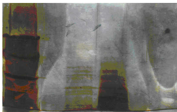
شکل ۱: تعیین وزن مولکولی آنزیم آلکالین پروتئاز با روش SDS-PAGE برای اثبات خالص سازی از روش پلی آکریل آمید ژل الکتروفورز (PAGE) استفاده گردید و تشکیل یک باند منفرد خلوص آن را اثبات کرد (شکل ۲).

در این پژوهش با استفاده از یک ستون تعویض کاتیونی فراکسیون های ۲ میلی لیتری ۲۱ تا ۱۴ جمع آوری گردید و همان گونه که در شکل ۱ دیده می شود جداسازی کافی و مناسب به نظر می رسد آنزیم تولیدی در این پژوهش نیز با ۵۰ مرتبه خالص سازی در نهایت راندمان خالص سازی ۲۴٪ را داشت. با روش SDS-PAGE وزن ملکولی این آنزیم ۲۴۷۰۰ دالتون تعیین گردید (شکل ۱)