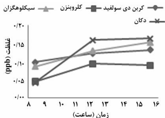
نمودار ۱- تغییرات روزانه غلظت دکان، کربن دی سولفید، کلروبنزن و سیکلوهگزان در تهران در سال ۱۳۸۹

*AK (آلکین)، AR (آروماتیک)، OF (اولفین) و PR (پارافین)