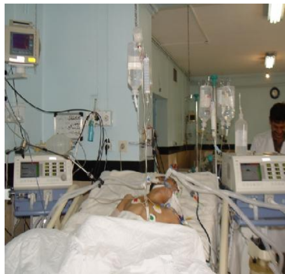
شکل ۲- بیمار تحت تهویه با دو ونتیلاتور Evita 2

چپ ۱ میلی‌لیتر بر کیلوگرم روزانه افزایش داده می‌شد. بیمار تحت تهویه با دو ونتیلاتور Evita 2 در تصویر ۲ نشان داده شده است: