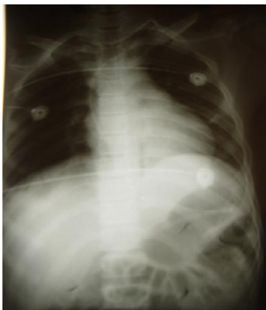
شکل ۳- CXR مجدد در زمان بهبودی

با باز شدن ریه چپ، داروهای آرام بخش بیمار به تدریج قطع گردید و خروج لوله تراشه بیمار با موفقیت انجام شد. با تداوم درناژ وضعیتی، فیزیوتراپی و هیدریشن و استفاده از داروهای خلط آور پس از ۵ روز دیگر با حال عمومی خوب و با GCS:14/15 از ICU ترخیص شد. شکل ۴ بیمار را در حال بهبودی نشان می‌دهد.