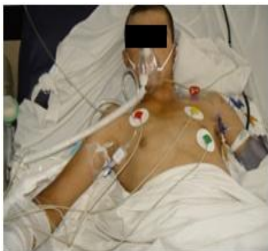
شکل ۴- بیمار در حالت بهبودی

با باز شدن ریه چپ، داروهای آرام بخش بیمار به تدریج قطع گردید و خروج لوله تراشه بیمار با موفقیت انجام شد. با تداوم درناژ وضعیتی، فیزیوتراپی و هیدریشن و استفاده از داروهای خلط آور پس از ۵ روز دیگر با حال عمومی خوب و با GCS:14/15 از ICU ترخیص شد. شکل ۴ بیمار را در حال بهبودی نشان می‌دهد.