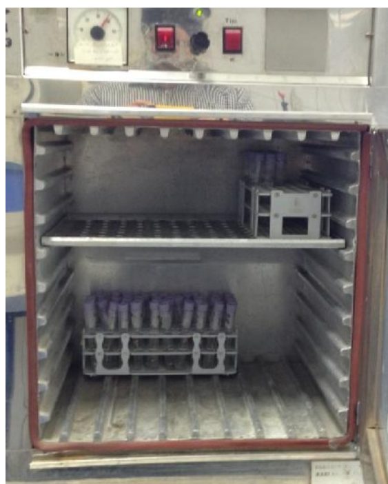
شکل ۲- دستگاه‌های ارتودنسی شبیه‌سازی شده در لوله‌های

شیشه‌ای محتوی بزاق مصنوعی در انکوباتور ۳۷ درجه سانتی‌گراد