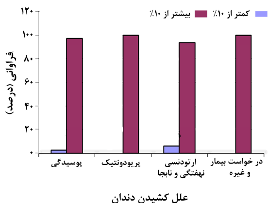
نمودار ۲- توزیع فراوانی نسبی علل کشیدن دندان بر حسب وضعیت بهداشت دهان در نمونه‌های مورد مطالعه

(ایندکس زیر ۱۰٪) بودند و بقیه بیماران (۹۹/۴٪)، بهداشت دهان و دندان ضعیف داشتند. آزمون مجذور کای تفاوت آماری معنی‌داری بین علل خارج کردن دندان و وضعیت بهداشت دهان نشان نداد (نمودار ۲).