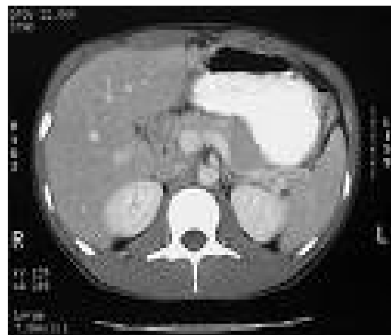
شکل ۵- سی تی اسکن شکم بیمار

سی تی اسکن شکم با کنتراست خوراکی و وریدی یافته‌ای غیرطبیعی در ارگان‌های شکمی و از جمله پانکراس نشان نداد (شکل ۵).