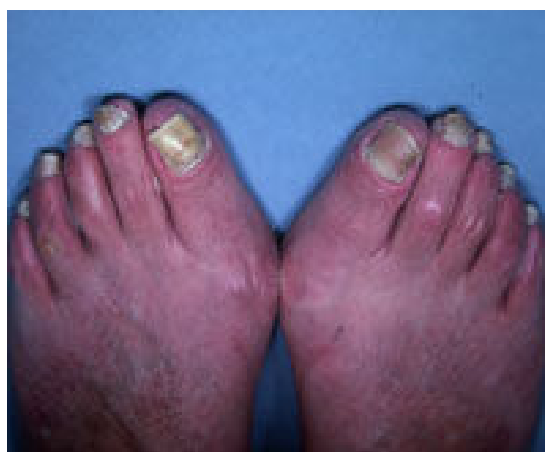
شکل ۱- تغییرات ایجاد شده در ناخن‌های پا در بیمار مبتلا به سندرم ناخن زرد

معاینه ناخن‌های دست و پای بیمار، شکنندگی، تغییر شکل و زرد رنگ بودن آنها نشان می‌داد [شکل ۱ و ۲].