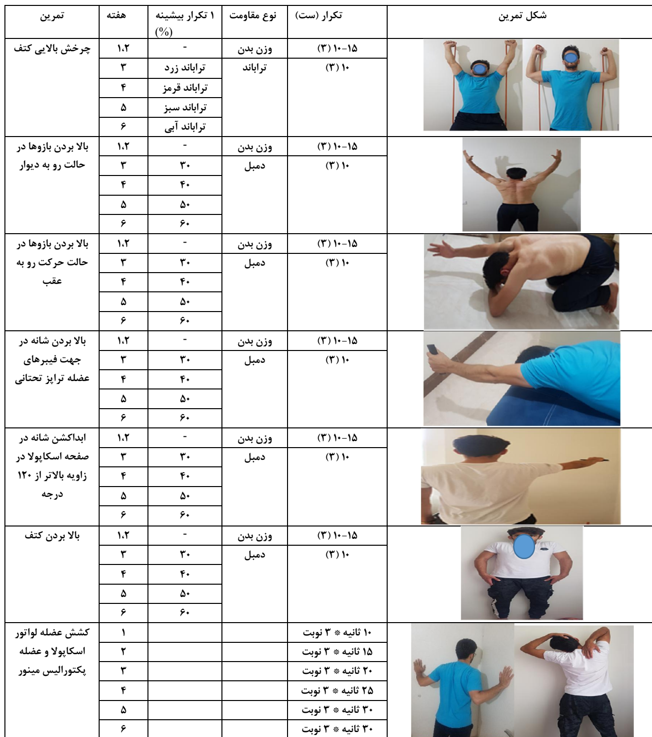
جدول ۱- پروتکل تمرینات اصلاحی کتف در طی شش هفته در افراد دارای نقص چرخش پایینی کتف