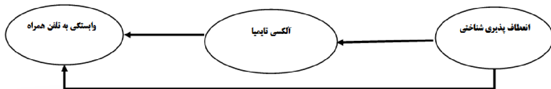
نمودار ۱- مدل مفهومی پیش‌بینی وابستگی به تلفن همراه بر اساس انعطاف‌پذیری شناختی با میانجی‌گری ناگویی هیجانی در دانشجویان دانشگاه

ارتباط محکم بین ناگویی هیجانی و اعتیاد به تلفن همراه اشاره کرده‌اند [۱۵]. ناگویی هیجانی به مشکل در شناسایی و توصیف احساسات خود و دیگران و ناتوانی در تمایز بین احساسات و سبک شناختی بیرونی خود و دیگران اشاره دارد [۱۶]. افراد دارای ناگویی هیجانی به دلیل کمبود توانایی شناختی، معمولاً در مواجهه با شرایط استرس‌زا مشکل دارند [۱۷] و به تبع آن احساسات منفی مانند اضطراب، افسردگی و استرس بیش‌تری را تجربه می‌کنند [۱۸]. Hao و همکاران در مطالعه خود نشان دادند بین ناگویی هیجانی و وابستگی به تلفن همراه به صورت مستقیم و غیرمستقیم ارتباط وجود دارد [۱۵]. با این حال، برخی از مطالعات اخیر به جهت دیگر اشاره کردند و نشان دادند که ناگویی هیجانی، اضطراب، استرس و افسردگی پیش‌بینی‌کننده‌های مثبت وابستگی به تلفن همراه هستند [۱۹]. هم‌چنین Mei و