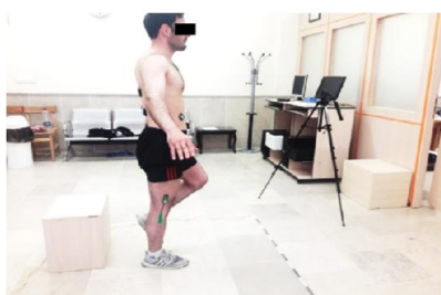
شکل ۱- فرود تک پا