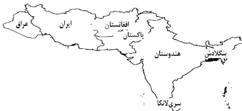
شکل ۳- کمربند جغرافیایی خودسوزی

این شیوه خودسوزی به شکلی است که راقم این سطور از آن تحت عنوان «کمربند جغرافیایی خودسوزی» نام برده است، چرا که بخش‌هایی از کشورهای بنگلادش، سری‌لانکا، هندوستان، پاکستان، افغانستان، ایران و کردستان عراق، درگیر این مشکل هستند [۲۷-۲۸]. تصویر ۳ نشان دهنده کمربند جغرافیایی خودسوزی است.