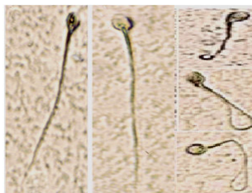
شکل ۱- اسپرم‌های زنده (دم پیچ خورده) و مرده (دم صاف) در مجاورت محلول هیپواسمولار.

پس از مجاورت با محلول هیپواسمولار، از اسپرم‌ها اسلاید تهیه شد و پس از ثابت شدن در متانول به مدت ۴۵ دقیقه، با استفاده از میکروسکوپ نوری، ۲۰۰ اسپرم از هر اپندورف شمارش و بر اساس شکل دم، درصد اسپرم‌های زنده (دم پیچ خورده) و مرده (دم صاف) (شکل ۱) تفکیک شدند.