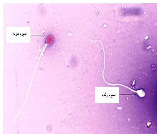
شکل ۳- تصویر اسپرم زنده (فاقد رنگ) و مرده (رنگ قرمز) در تکنیک ENT.

سوم و کنترل با ۲۰ میکرولیتر از ائوزین 1\% مخلوط شد. بعد از ۳۰ ثانیه، ۳۰ میکرولیتر از محلول نیگروزین 10\% به مخلوط قبلی اضافه و به آرامی مخلوط گردید. ۳۰ ثانیه بعد، از مخلوط نهایی لام تهیه شد و با استفاده از میکروسکوپ نوری با فیلد 200 \times 1000 اسپرم از هر اپندورف شمارش و بر اساس جذب یا عدم جذب رنگ ائوزین تفکیک شدند (شکل ۳).