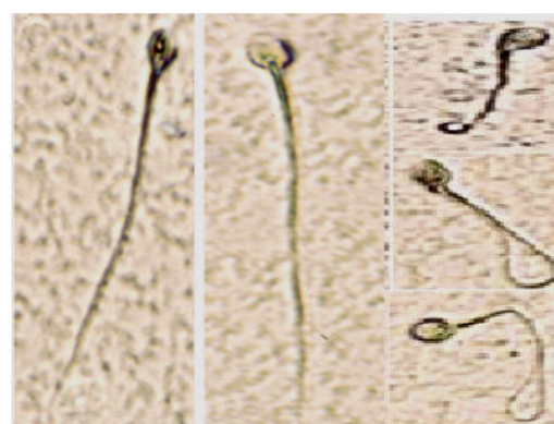
شکل ۱- اسپرم‌های زنده (دم پیچ خورده) و مرده (دم صاف) در مجاورت محلول هیپواسمولار.

پس از مجاورت با محلول هیپواسمولار، از اسپرم‌ها اسلاید تهیه شد و پس از ثابت شدن در متانول به مدت ۴۵ دقیقه، با استفاده از میکروسکوپ نوری، ۲۰۰ اسپرم از هر اپندورف شمارش و بر اساس شکل دم، درصد اسپرم‌های زنده (دم پیچ خورده) و مرده (دم صاف) (شکل ۱) تفکیک شدند.