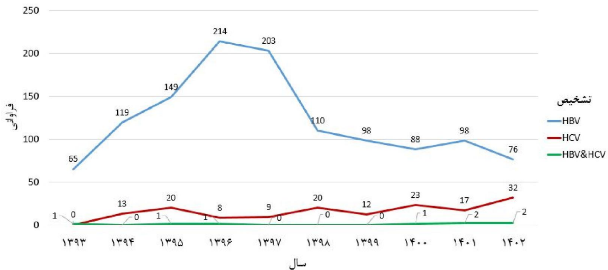
نمودار ۲- روند تغییرات فراوانی هپاتیت B و C و فراوانی هم‌زمان در حوزه دانشگاه علوم پزشکی جیرفت طی سال‌های ۱۳۹۳ تا ۱۴۰۲

B و ۹ مورد (۸/۵ درصد) برای هپاتیت C، تماس جنسی مشکوک که ۴ مورد (۰/۳ درصد) برای هپاتیت B و ۴ مورد (۲/۶ درصد) برای هپاتیت C، تزریق خون یا فرآورده‌های خونی ۸ مورد (۰/۷ درصد) برای هپاتیت B و ۲۵ مورد (۱/۱۶ درصد) برای هپاتیت C، حاملگی ۲۱۲ مورد (۴/۱۷ درصد) فقط برای هپاتیت B، خالکوبی و تاتو که ۱۳ مورد (۱/۱ درصد) برای هپاتیت B و ۸ مورد (۵/۲ درصد) برای هپاتیت C، اقامت در زندان و مراکز بازپروری ۳ مورد (۰/۲ درصد) برای هپاتیت B و ۲ مورد (۳/۱ درصد) برای هپاتیت C، بیماران خاص (دیالیزی-هموفیلی-تالاسمی) ۱ مورد (۰/۱ درصد) برای هپاتیت B و ۴ مورد (۲/۶ درصد) برای هپاتیت C، سایر موارد که ۳۳۲ مورد (۲۷/۲ درصد) برای هپاتیت B و ۲۵ مورد (۱۶/۱ درصد) برای هپاتیت C که شامل عوامل غیرمشخص دیگر می‌شود.