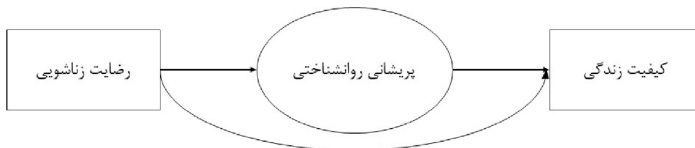
شکل ۱- ارتباط بین رضایت زناشویی و کیفیت زندگی با میانجی‌گری پریشانی روان‌شناختی در مادران دارای کودکان مبتلا به سرطان

با توجه به شیوع فزاینده سرطان در کودکان و تأثیرات عمیق آن بر سلامت روانی مادران به عنوان اصلی‌ترین مراقبان (۳، ۱)، بررسی رابطه بین رضایت زناشویی و کیفیت زندگی با در نظر گرفتن نقش میانجی‌گری پریشانی روان‌شناختی از اهمیت بالینی و اجتماعی برخوردار است. اگرچه مطالعات پیشین به بررسی جداگانه این متغیرها پرداخته‌اند، اما نقش یک‌پارچه آن‌ها در