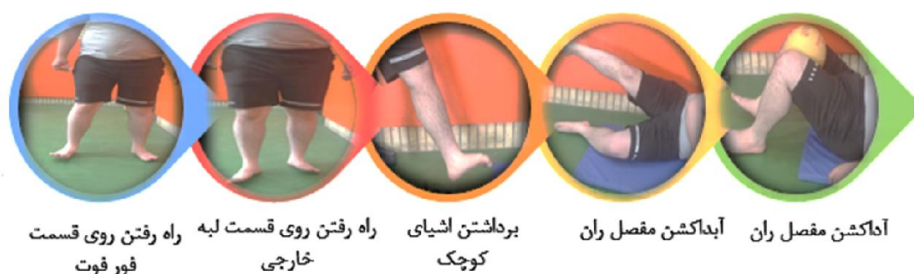
تصویر ۱- تمرینات اصلاحی جهت اصلاح ناهنجاری پروتئین

۵- حرکت آبداکشن ران: به طوری که یک ساق پا به طور خمیده با سطح زمین تماس پیدا می‌کند، و ساق پا به طوری که عمود بر