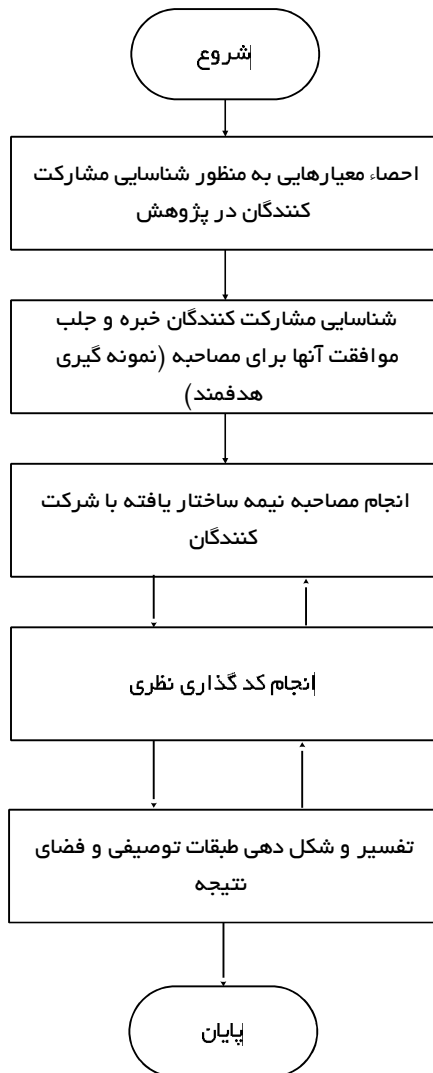
شکل ۱- فرآیند انجام پژوهش به منظور شناسایی عوامل مؤثر در انتشار دانش نامعتبر

در تحقیقات کیفی نمونه‌گیری به صورت هدفمند می‌باشد و مبنای انتخاب مصاحبه شونده‌گان افرادی است که قادر هستند بیشترین اطلاعات را در مورد موضوع پژوهش فراهم آورند و معیارهای نمونه‌گیری را برآورده می‌سازند [۴۲]. لذا در این پژوهش نیز از نمونه‌گیری هدفمند استفاده گردید و با ۱۲ نفر از افرادی که در زمینه موضوع مورد بحث دانش و تجربه کافی داشتند، مصاحبه