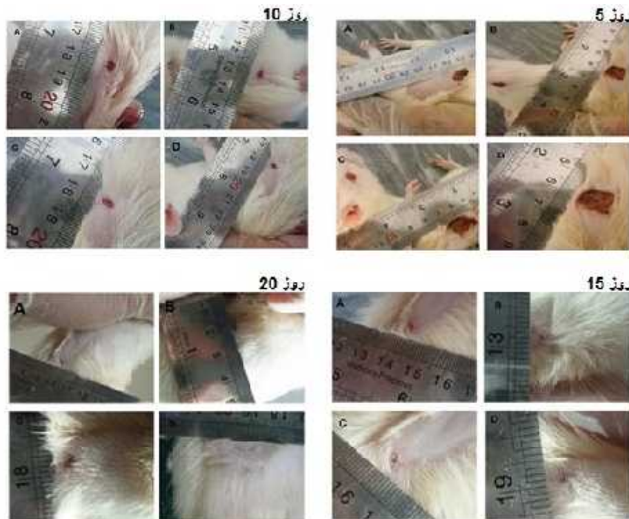
شکل ۱- تصاویر ماکروسکوپی از زخم‌های پوستی گروه‌های مورد مطالعه در روزهای مختلف اندازه‌گیری (A: گروه اوسرین، گروه‌های تحت درمان با B: گل اشرفی، C: گروه صبر زرد، D: گروه کرچک).