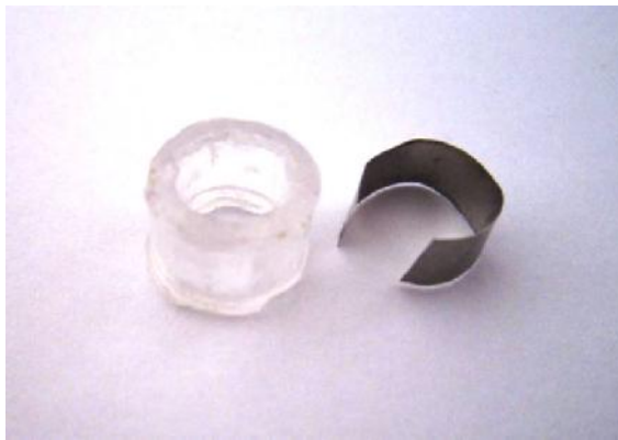
شکل ۱- مولد جهت تهیه دیسک‌های کامپوزیت رزین

هر یک از لوله‌ها با کامپوزیت رزین P60 (3M ESPE, St. Paul, MN, USA) به صورت یک لایه‌ای پر شدند. برای پلیمریزه کردن کامپوزیت رزین در گروه‌های اول و دوم از دستگاه لایت کیور هالوژن Coltolux75 (Coltene, Whaledent, NJ, USA) به ترتیب به مدت ۲۰ و ۴۰ ثانیه، با شدت 800 \text{ mw/cm}^2 و با حداقل فاصله از سطح کامپوزیت رزین کیور شدند.