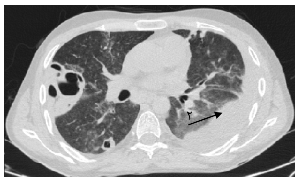
تصویر ۳- ضایعه اوپاک در ریه سمت چپ (پیکان ۱) به همراه کاویته در ریه سمت راست (پیکان ۲) در HRCT