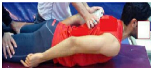
۱۲. ارزیابی قدرت راست کردن تنه