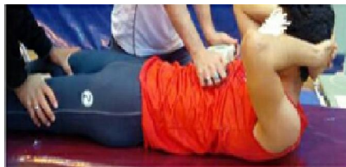
۱۱. ارزیابی قدرت خم کردن تنه