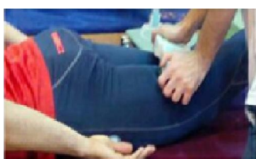
۱۵. ارزیابی قدرت راست کردن ران