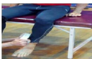
۱۴. ارزیابی قدرت چرخش خارجی ران