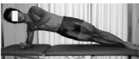
d. آزمون پلانک از طرفین