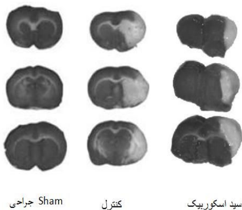
شکل ۱- برش‌های مغزی رنگ‌آمیزی شده با ترازولیوم کلرید که ۴۸ ساعت پس از سکتة مغزی مدل آمبولیک از گروه‌های Sham جراحی، اسید اسکوربیک و کنترل به دست آمده است.

هیچ‌گونه انفارکتوس، ادم مغزی، اختلال نورولوژیک و یا تشنجی در گروه کنترل جراحی مشاهده نگردید. آمبولیزه کردن (به حرکت در آوردن) یک لخته از قبل تشکیل شده به داخل شریان مغزی میانی منجر به بروز انفارکتوس در نواحی که این شریان خون‌رسانی آن‌ها را بر عهده دارد و عمدتاً شامل بخش‌هایی از قشر مغز و استریاتوم است، می‌شود (شکل ۱؛ ناحیه انفارکتوس روشن و ناحیه سالم تیره‌تر دیده می‌شود).