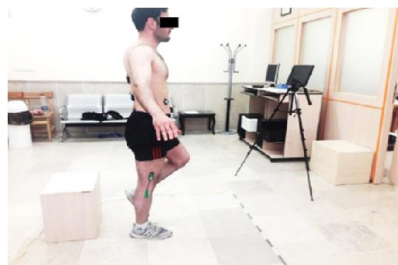
شکل ۱- فرود تک پا